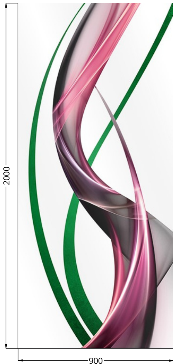
WIDOK OD STRONY WEW.

Nadruk cyfrowy na całej powierzchni, bez części przeziernych