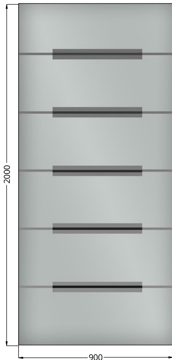
WIDOK OD STRONY WEW.

Nadruk cyfrowy na całej powierzchni, bez części przeziernych